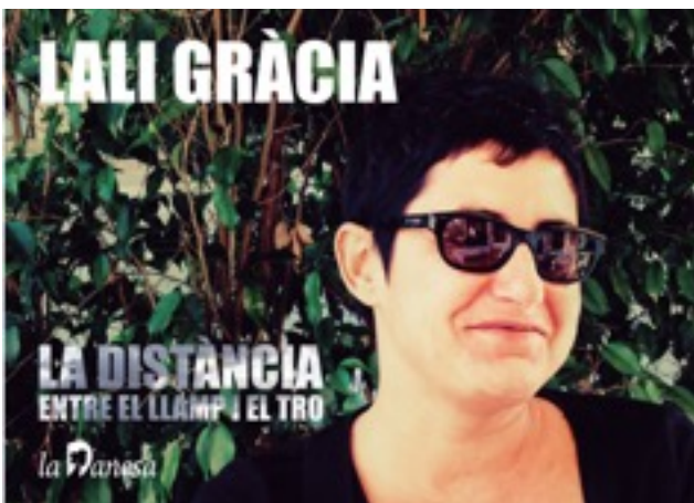
Lali Gràcia Comunicació