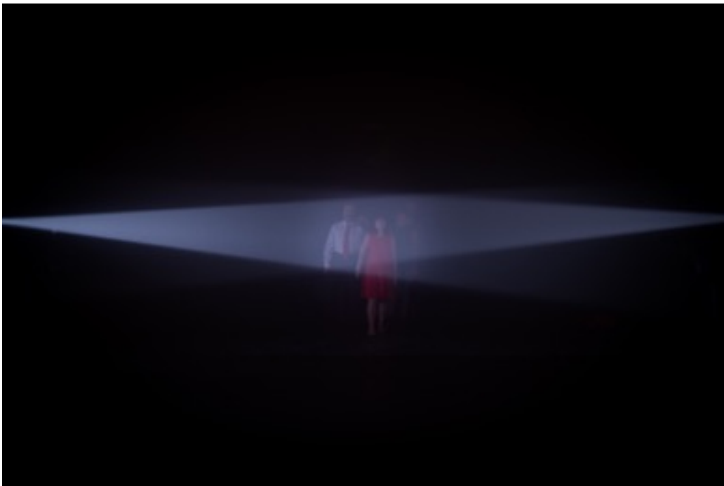
Fotografía © Pep Gol

Ensayo sobre la Lucidez nos sitúa en un momento en que la transformación -a consecuencia de la ceguera- se concreta en una acción lúcida. Y hay alguien que ve. Y actúa en consecuencia. Ante esa sociedad nueva, transformada por una acción violenta, catártica, acaecida cuatro años atrás, un poder que nos puede parecer grotesco, hierde. Mata.